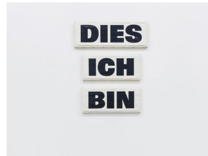
DIES / ICH / BIN, 1990–1997, Privatsammlung, Zürich, Foto Peter Baracchi