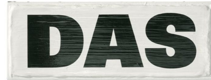
NUR / DAS, 1990–1997, Privatsammlung, Zürich