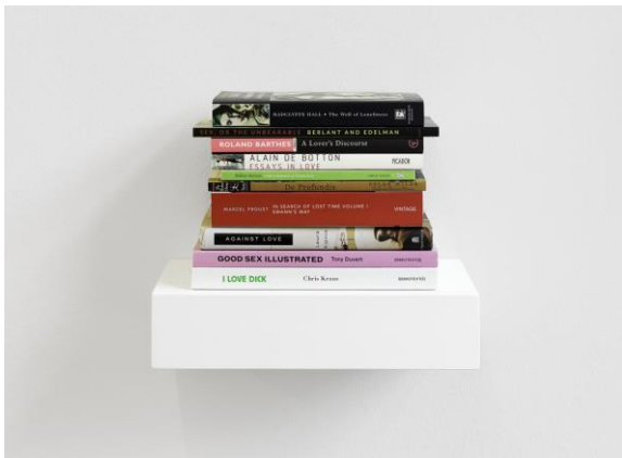
Erdem Taşdelen, Genealogy, 2010-heute