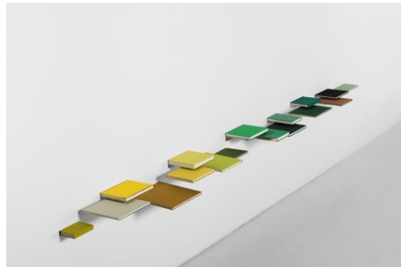
Fernanda Fragateiro, Landscape & Power, 2016