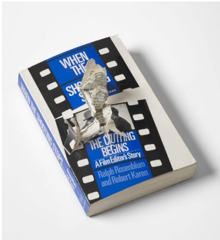
Mika Taanila, Filmreader, 2017