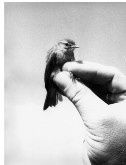
Jochen Lempert, Vogel in der Hand (Zilpzalp), 1998

Der besondere Dank gilt den Förderern und Dauerleihgebern, die seit über 15 Jahren am Aufbau der Sammlung teilhaben.