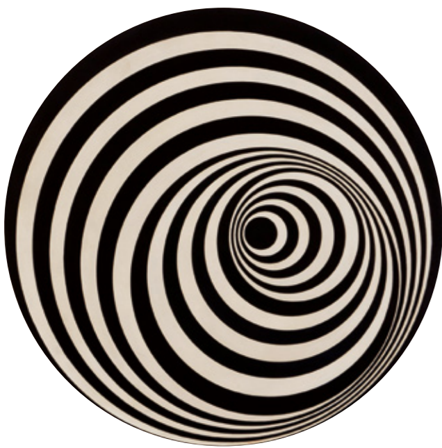
Bridget Riley, Uneasy Centre, 1963 © Bridget Riley

In unserer Sonderpräsentation treffen sich Schwarz und Weiß – sowohl Neuerwerbungen als auch bekannte Werke aus der Sammlung Lambrecht-Schadeberg. Was nach einem simplen Prinzip klingt, zeigt sich hier in vielfältigen, spannenden Facetten. Der Blick konzentriert sich auf Gestus, Linien oder materialbedingte Eigenheiten. Durch die abwechslungsreiche Zusammenstellung erweitert sich das Feld der möglichen Interpretationen – sowohl von Künstler- als auch von Betrachterseite.