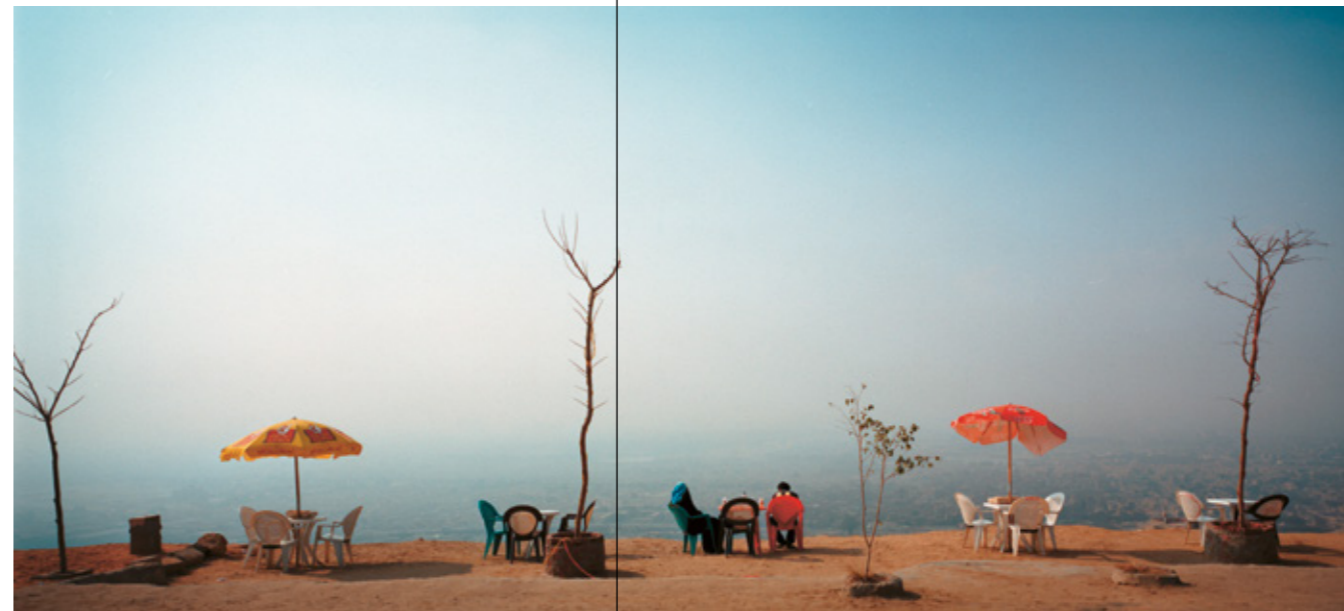
Armin Linke, Restaurant View Cairo Egypt, 2006 © VG Bild-Kunst, 2018