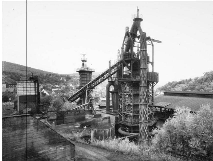
Bernd und Hilla Becher, Eiserfelder Hütte, 1972