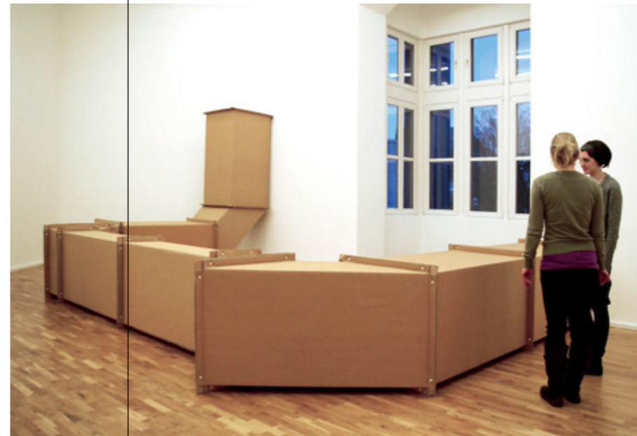
Charlotte Posenenske, Vierkanthrohe Serie DW, 1967 © Nachlass Charlotte Posenenske / Burkhard Brunn.

Museum für Gegenwartskunst Siegen Unteres Schloss 1 57072 Siegen Telefon 0271 405 77 10 info@mgk-siegen.de www.mgk-siegen.de www.facebook.com/MGK.Siegen