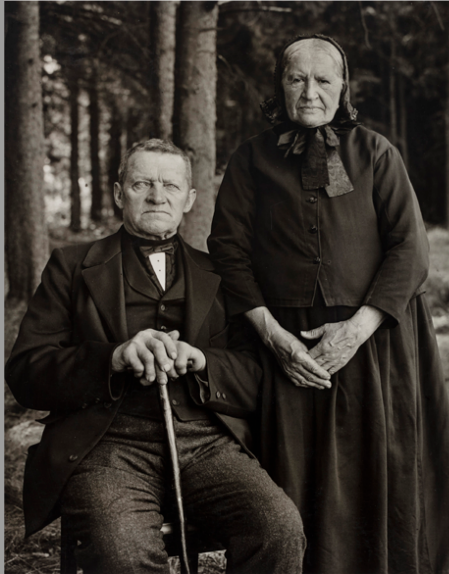
August Sander, Bauernpaar – Zucht und Harmonie, 1912