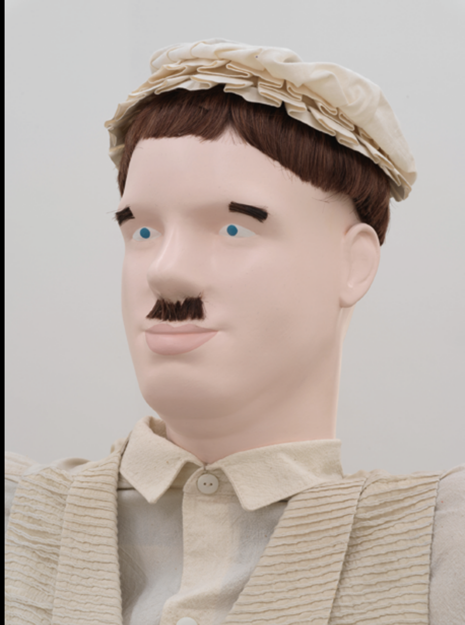
Jos de Gruyter und Harald Thys, The Town Crier, 2019

Well here, people have never seen an image of themselves in 3D before, this is their first time.