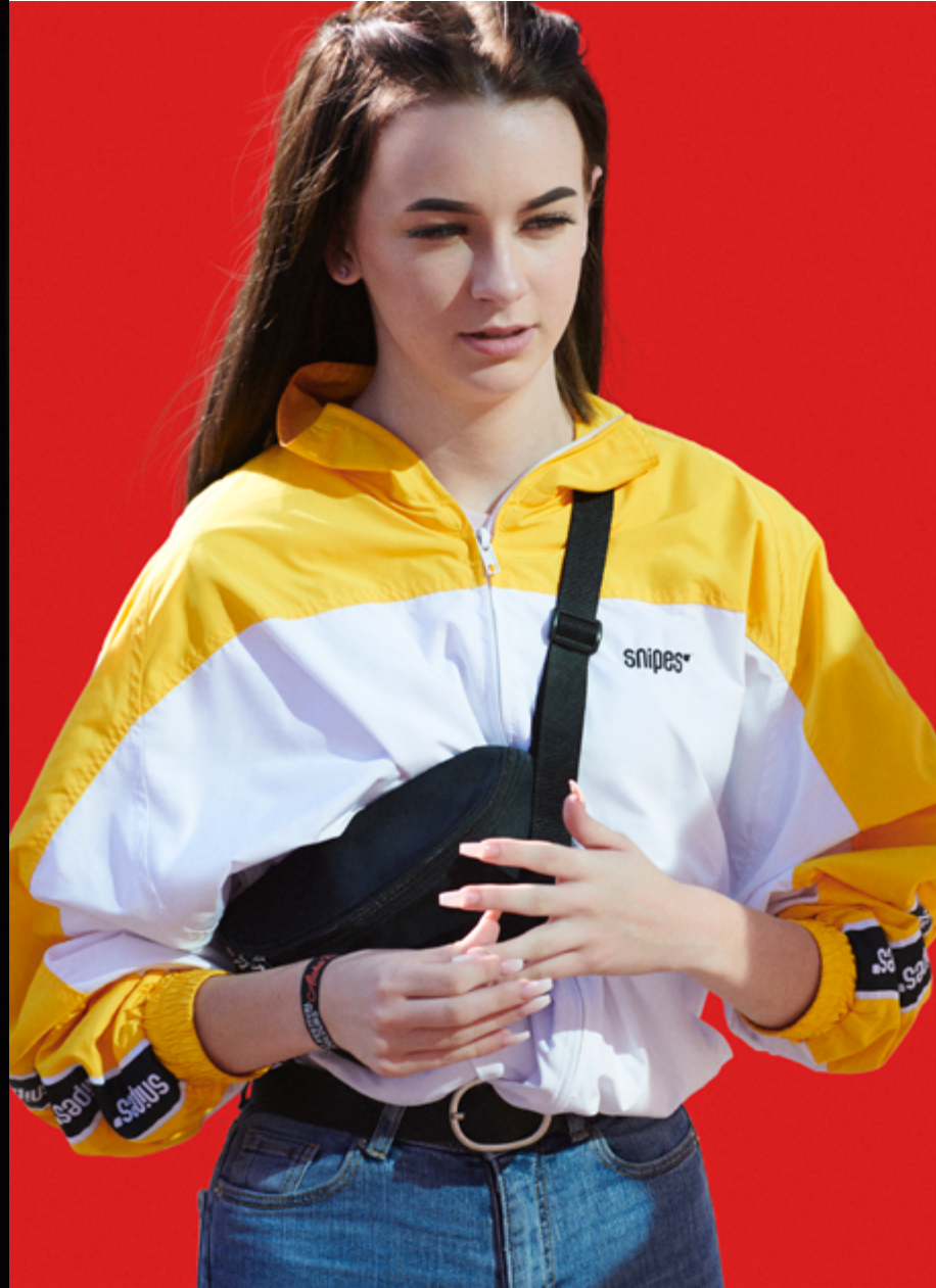
Ilya Lipkin, Untitled, 2019