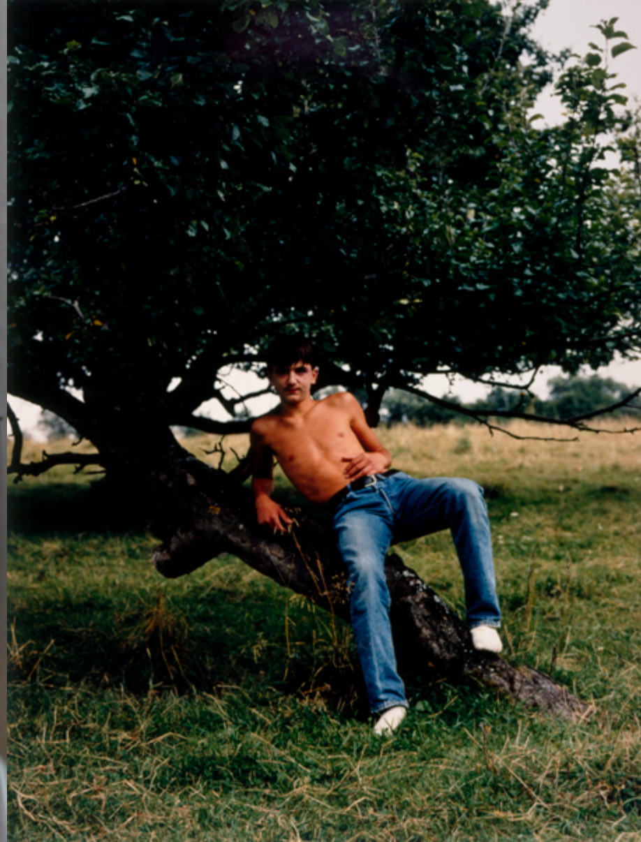
Collier Schorr, A Possible Mutation, 1994

Sandra Schärer, Westerntal: Eine Heimsuchung, 2021