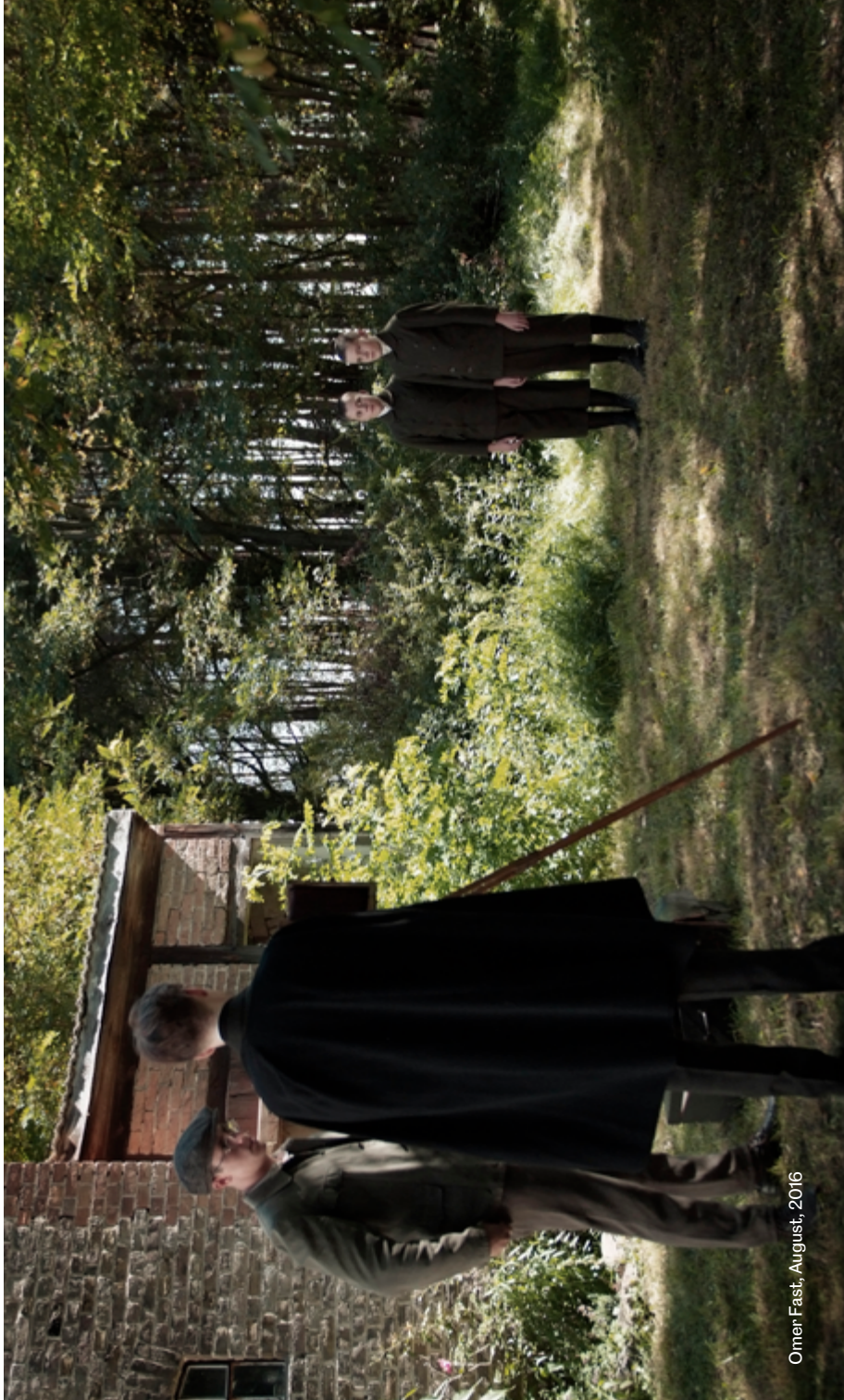
Omer Fast, August, 2016