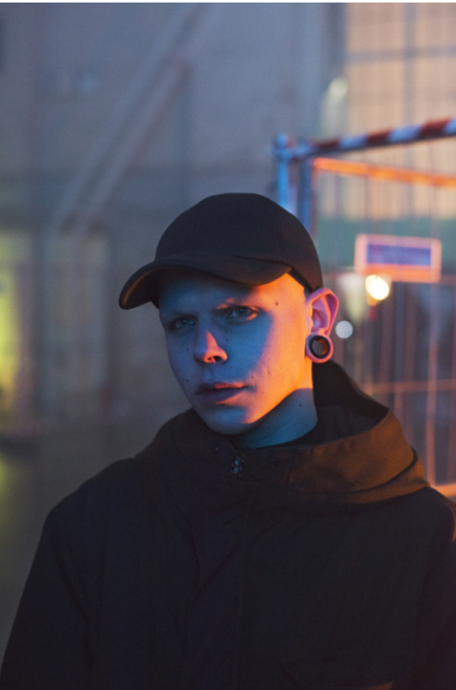
Tobias Zielony, Golden, 2018